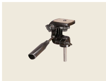
▲ HC-T2N カメラホルダ