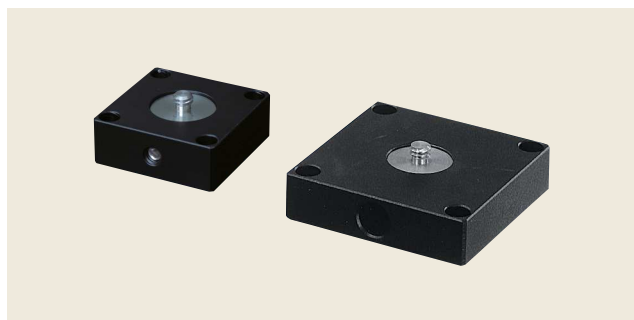
▲ HC-41/HC-61 カメラ取付アダプタ 1/4インチ