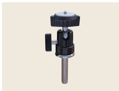
▲ HC-T3 カメラホルダ