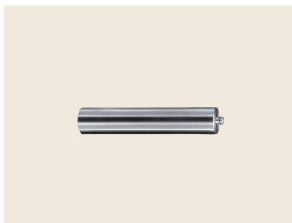
▲ HC-S1 カメラ用シャフト 1/4インチ