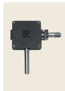
▲ C-56 片開きスリット