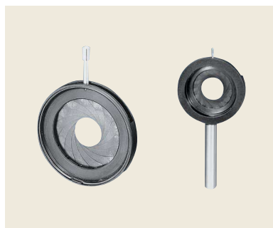
▲ AD-8 ~ 58/AD-8H ~ 58H 虹彩絞り/虹彩絞りホルダ付 開口φ8 ~ φ58