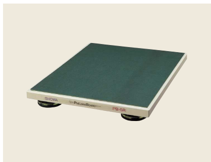
▲ PB-5R-4050 ~ 1070 卓上型除振台 (防振ゴム式)