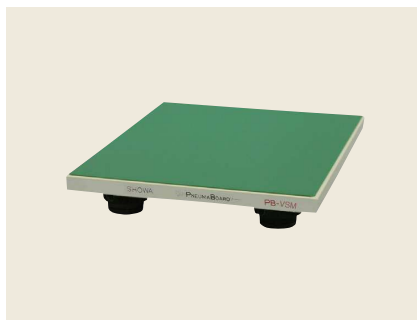
▲ PB-VSM-4050 ~ 1070 卓上型除振台