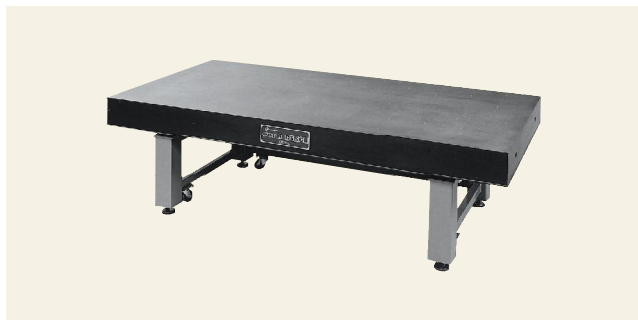
▲ ORR-1290 ~ 2412 精密除振台 (高減衰防振ゴム式)