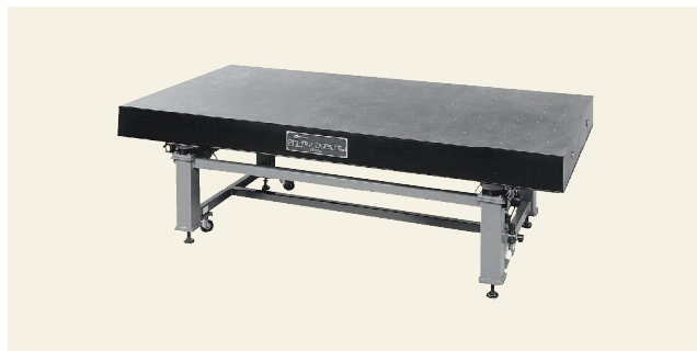
▲ ORE-1290 ~ 2412 精密除振台 (空気ばね式)