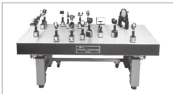
精密除振台使用例 フレネルホログラフィ