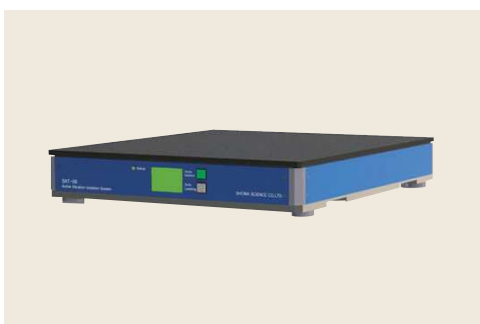
▲ SAT-45卓上型アクティブ除振台