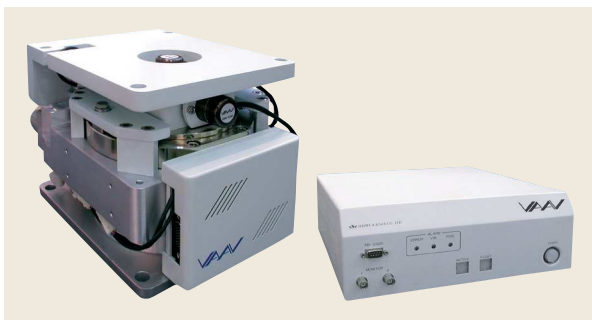
▲ アクティブ除振台ユニット