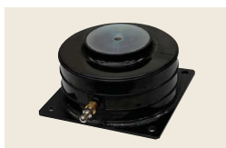
▲ ニューマクッション