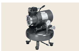
▲ CVS-200 コンプレッサ