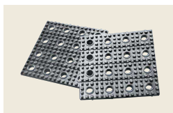
▲ TT-DR 防振パット