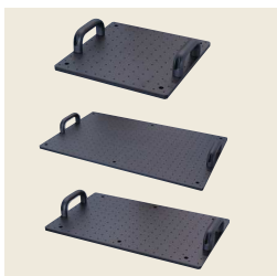
▲ アルミブレードボード