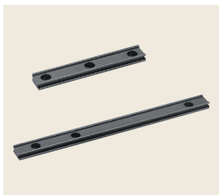
▲ RM-125/250 ミニレール