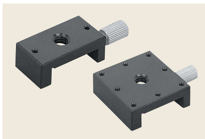
▲ C-221-(1) (2) ミニレールキャリア