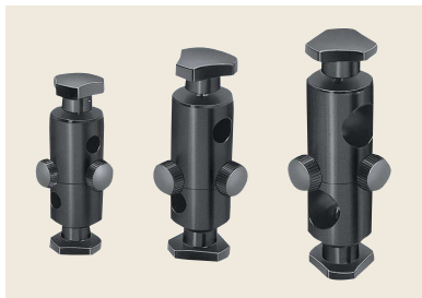
▲ CR-8-8/CR-12-12/CR-20-20 軽荷重用回転式クロスクランプ