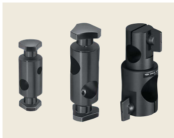
▲ CF-8-12/CF-20-20/CF-20-30 固定式クロスクランプ