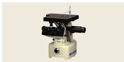
▲ VELNUS-E2 パーソナルマイクロスコープ