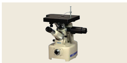
▲ VELNUS-D2 パーソナルマイクロスコープ