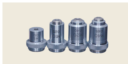
▲ OB-M5 / OB-M10 / OB-M20 / OB-M40 対物レンズ