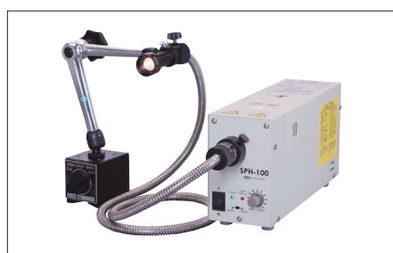
組み合わせ使用例