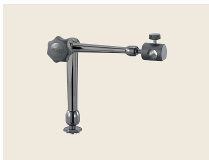
▲ LGH-1 ライトガイドホルダ M16P1