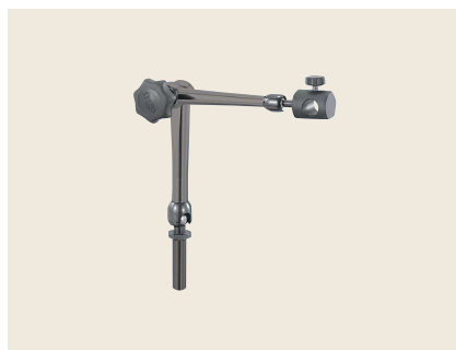
▲ LGH-2 ライトガイドホルダ φ12