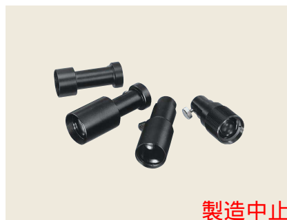
▲ LGL-30 / LGL-50 / LGL-70 / LGL-100 集光レンズ