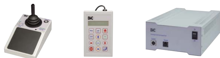
付属コントローラ : ジョイスティック、キーパッド、ドライバコントローラ