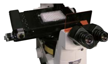
NIKON Ti-E への搭載例