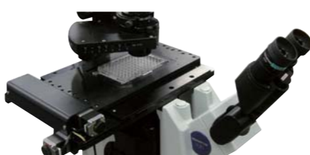
OLYMPUS IX81 への搭載例